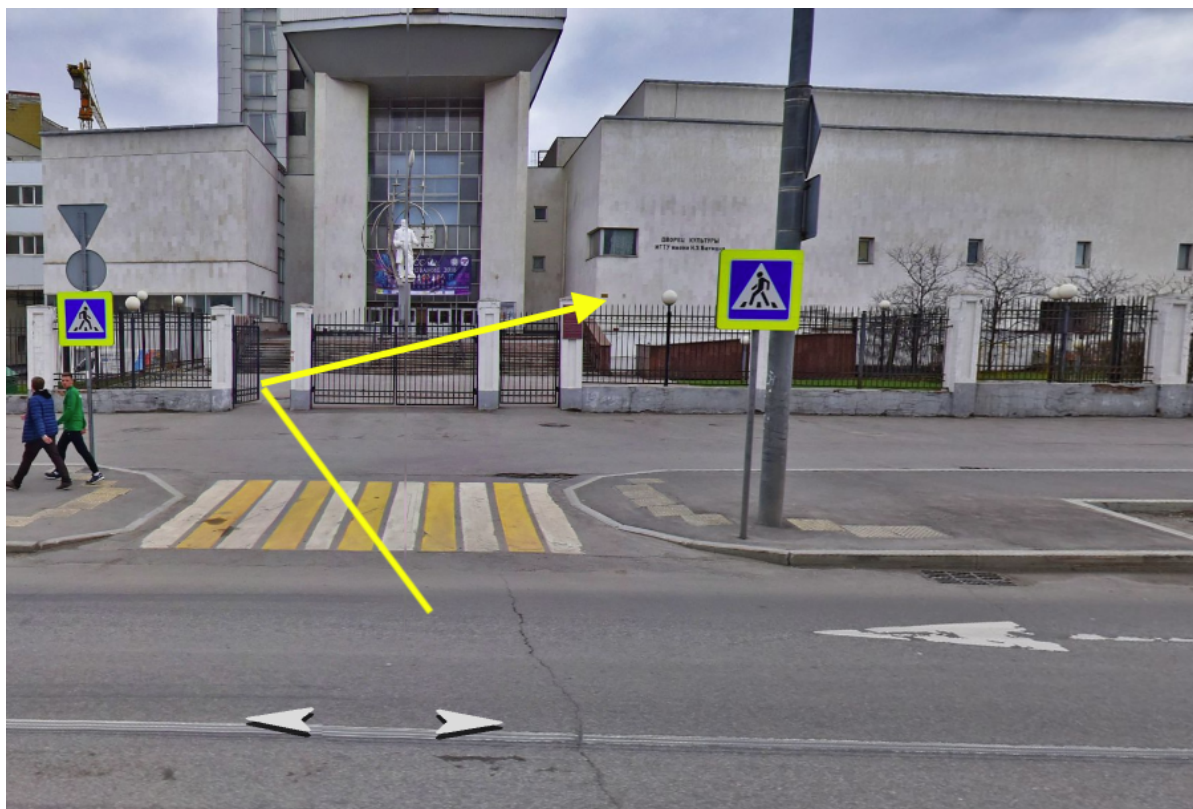
Проход в здание БЗДК при МГТУ им.Баумана

Обратите внимание, что вход в здание на конференцию отдельный! За забором поднимитесь по лестнице, не доходя до входа в УЛК поверните направо, двигайтесь по указателям на территории.